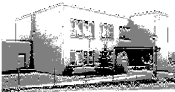
Mateřská škola při ZŠ Malšice, 391 75 Malšice 288